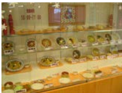
スエヒロのメニュー