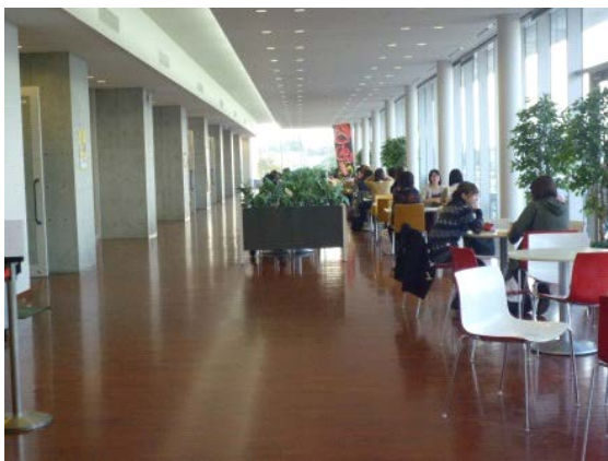
シダックス食堂内