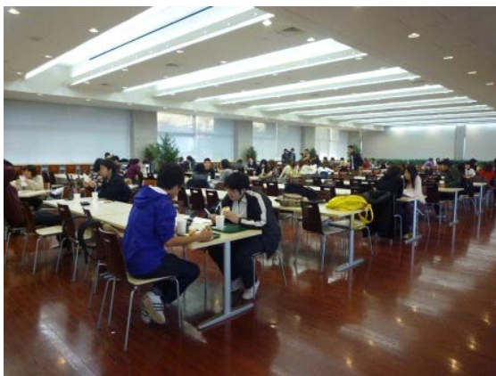
シダックス入り口付近

机やごみ箱の高さも少し低くなっていて、車椅子に乗っていても利用しやすいです。食事をするところは机と机の間が広くており車椅子も通れます。ただし、お昼は混雑することがあります。屋外でも食事することはできますが、段差があるので注意が必要です。